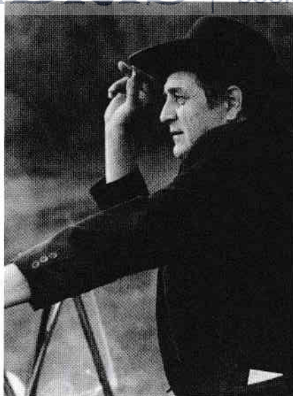
Pe malul lacului Haraga din Cernoleuca, 1984